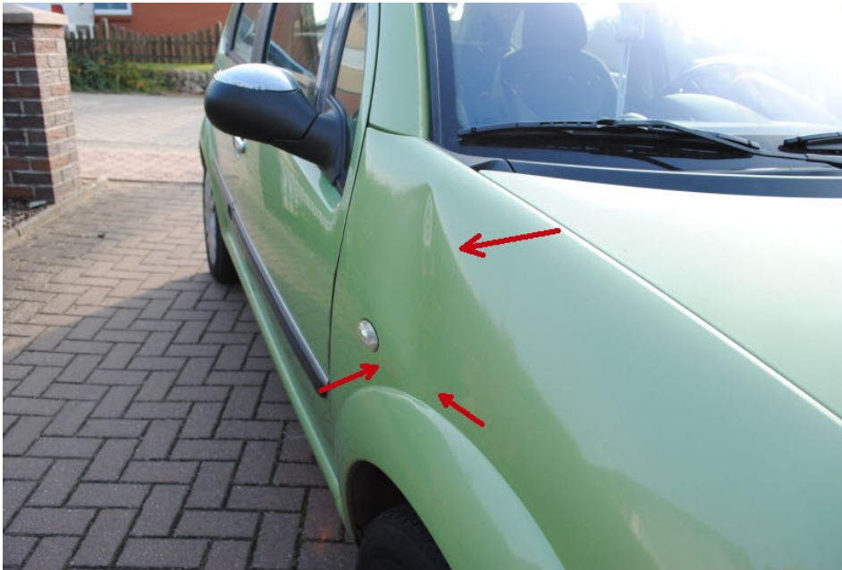
Bild 3 Vorderer rechter Kotflügel