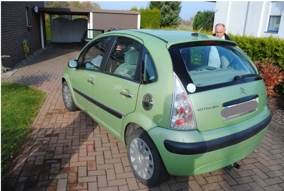
Bild 2 Fahrzeugheck und linke Seite