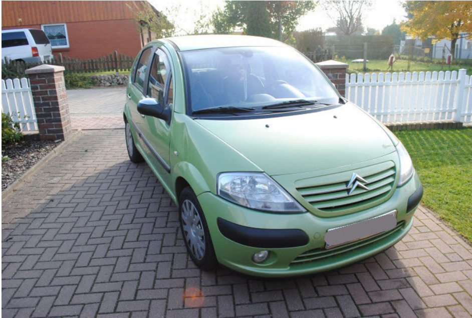
Bild 1 Fahrzeugbug und rechte Seite