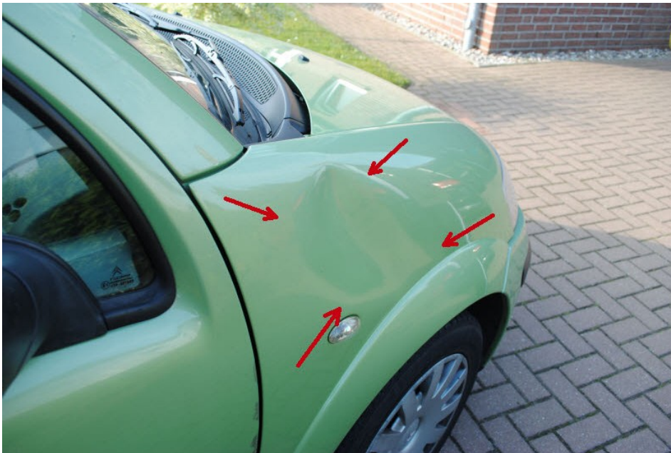
Bild 4 Vorderer rechter Kotflügel